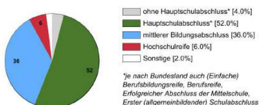
Auszubildende mit Schulabschluss 2022 (in %)

Rechtlich ist keine bestimmte Schulbildung vorgeschrieben. In der Praxis stellen Betriebe überwiegend Auszubildende mit Hauptschulabschluss* ein.